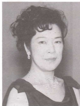
米持ゆか 〔ピアニスト〕